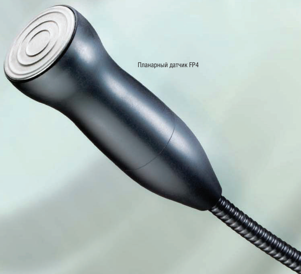
Планарный датчик FP4